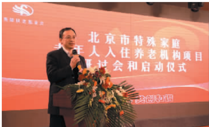
1月17日上午,特殊家庭老年人入住养老机构项目启动,北京市民政局副局长李红兵致辞。

第九条规定,由代理机构通过一定方式面向社会公开选择其他参与特殊家庭老年人服务的专业服务机构和组织,以自愿接受或签订协议的方式向特殊家庭老年人提供陪医、导诊、陪床、康复护理或志愿服务、法律援助等服务以及相关资产评估、管理等服务。